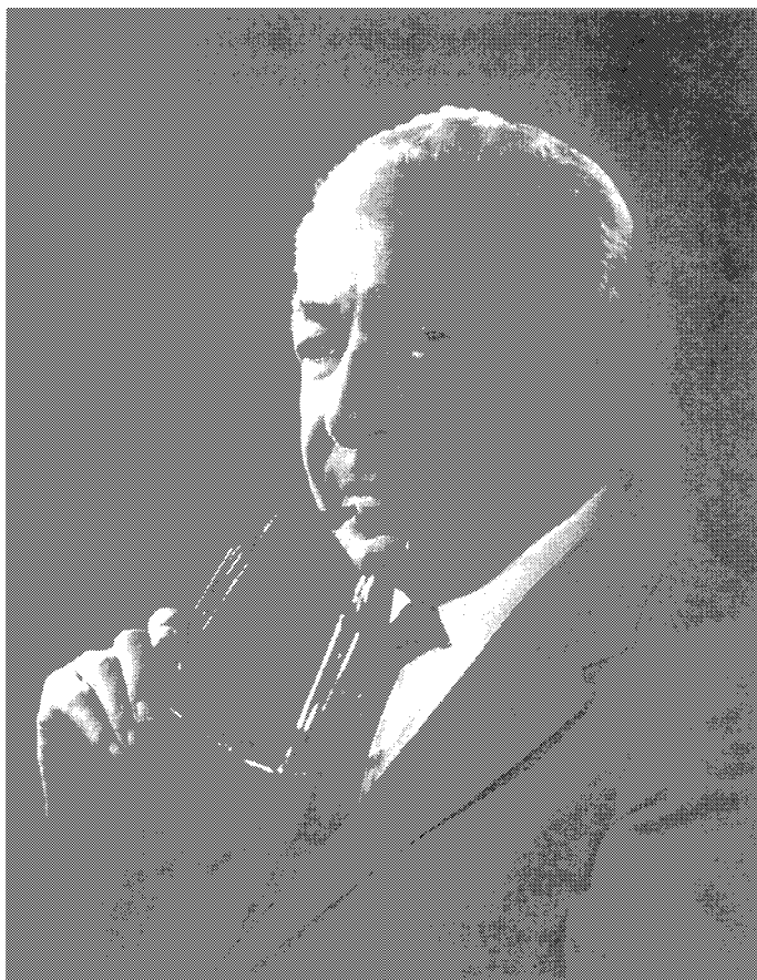
И. А. Раби в 1960-е годы.